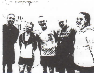
フェンシングカナダ代表 (女子フルーレチーム) 2019.10月