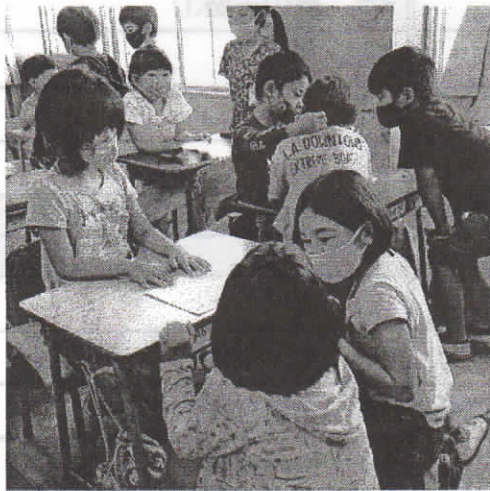
(5/19 1・2年生のペア活動)

新学期がスタートして、2ヶ月ほど経ちました。 昨年度は行うことができなかった「1年生を迎える会」は、密集を避ける形で行うことができました。